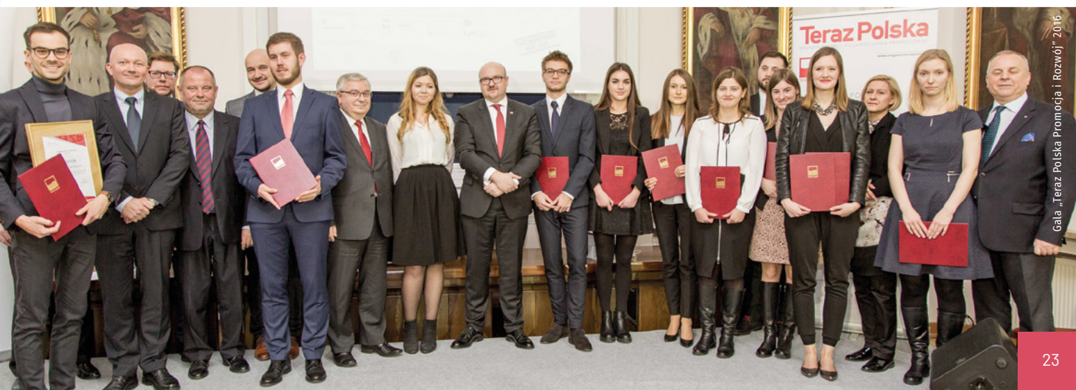
Gala „Teraz Polska Promocja i Rozwój” 2016