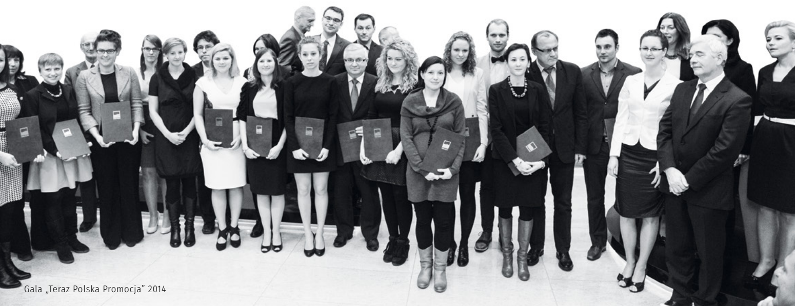
Gala „Teraz Polska Promocja” 2014